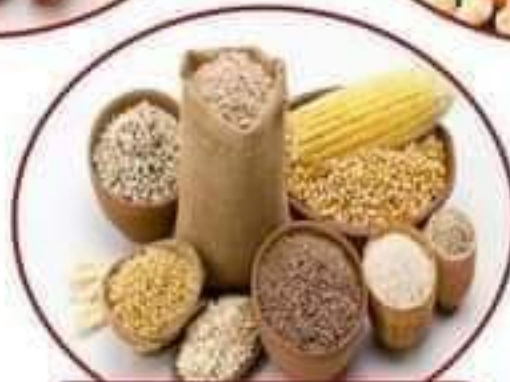
الحبوب و مشتقاته